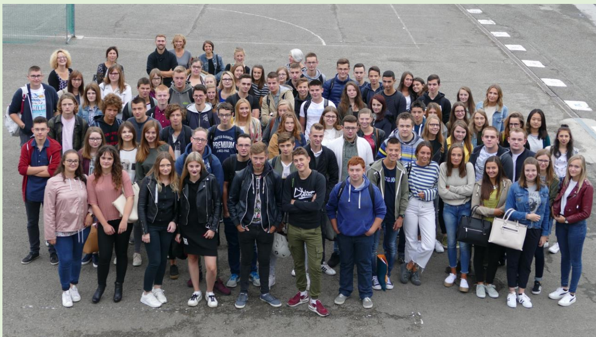
Nos futurs diplômés.

Notre pédagogie s'efforce d'être orientée sur la construction progressive du projet d'insertion du jeune dans la vie étudiante, sociale et professionnelle.