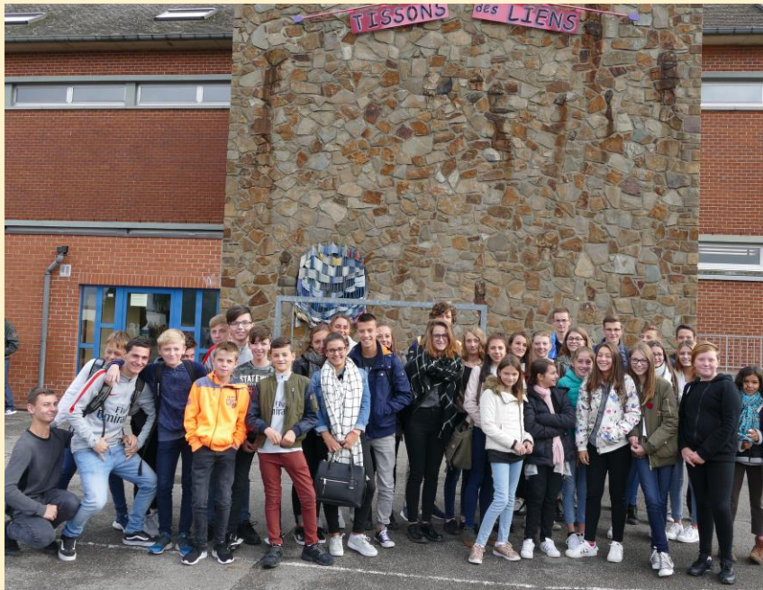
De la première à la rhéto, une communauté éducative soudée.